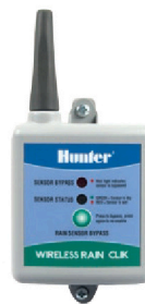
WR-CLIK-R (Prijímač) Výška: 8,3 cm Dĺžka: 10 cm