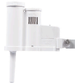
WR-CLIK-TR Výška: 7,6 cm Dĺžka: 20 cm